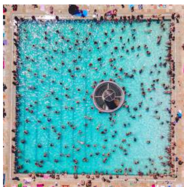
Piscina Tipo I - Municipal

Piscinas do Tipo 3: Todas as piscinas, à exceção de piscinas do Tipo 1, piscinas do Tipo 2 e piscinas de uso privado, conforme definido em 3.7. da [NP EN 15288-1].