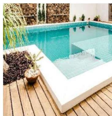
Piscina Tipo III - Familiar

Há ainda a considerar dois tipos de piscinas relativamente ao seu sistema de recirculação, sendo estas as piscinas de escumadores de superfície (Skimmers) e as piscinas de transbordo, sejam elas compostas por caleira finlandesa ou caleiras infinitas.